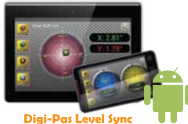
Digi-Pas Level Sync