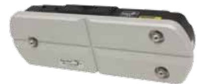
3-Points Contact Base