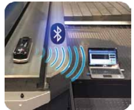
Digi-Pas ® 2-Axis levelling Utilizing Advanced Digital MEMS Technology