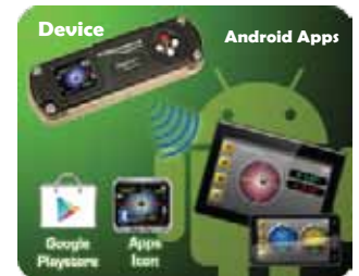
Bluetooth Connectivity Smartphone / Tablet